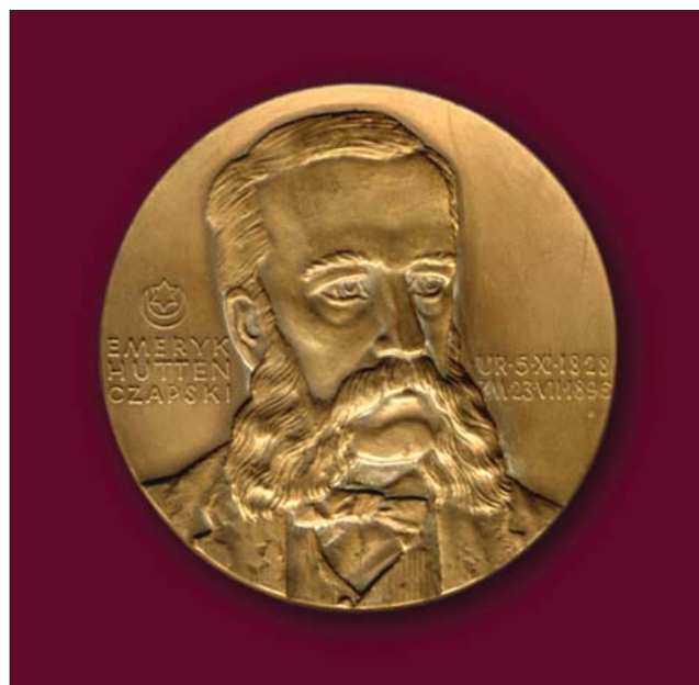
Эмерик Гуттен-Чапский на медали.

Современная нумизматика объявила своей приоритетной задачей комплексное исследование конкретных совокупностей монет, направленное на выявление нашедших в них отражение событий исто-