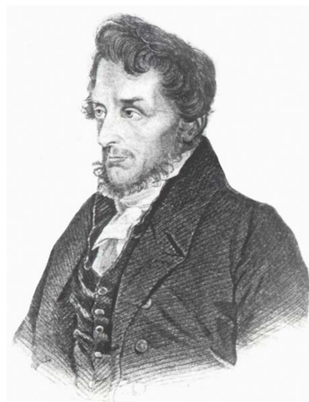
Иохим Лелевель (1786—1861)

Музеям, созданным при статистических комитетах пяти белорусских губерний 3 , принадлежали в те годы наиболее значительные нумизматические собра-